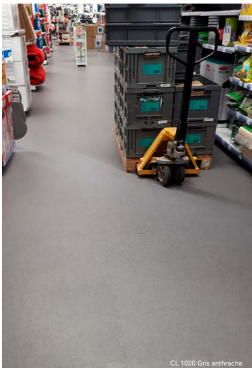
CL 1020 Gris anthracite

❏ Son système d'emboîtement par queue d'aronde permet une installation rapide, sans colle et sans arrêt de votre activité, car Modularité rime avec flexibilité !