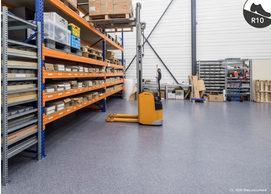
CL 1030 Bleu moucheté