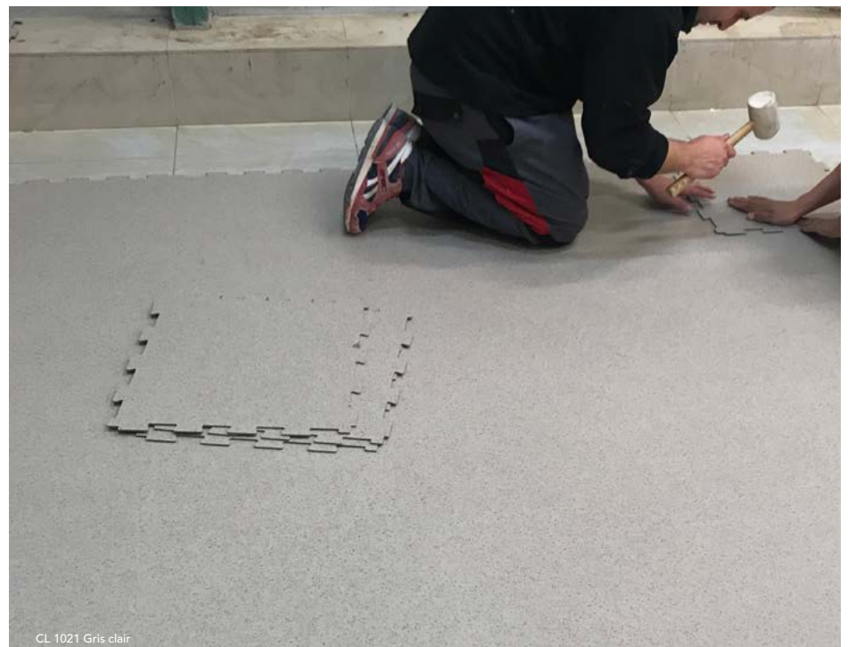
CL 1021 Gris clair