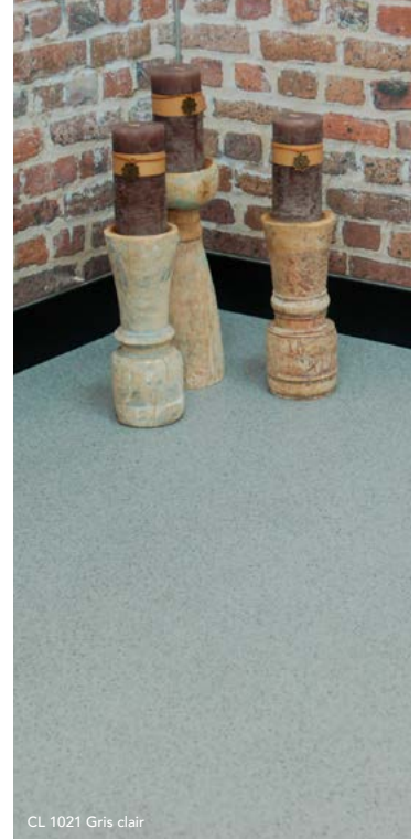
CL 1021 Gris clair

❏ Son système d'emboîtement par queue d'aronde permet une installation rapide, sans colle et sans arrêt de votre activité, car Modularité rime avec flexibilité !